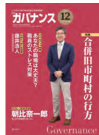
月刊ガバナンス (2015年)