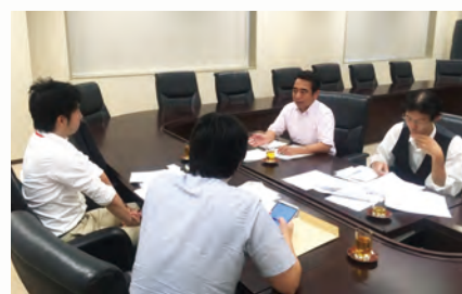
政策調査活動（中央官庁での打ち合わせ）