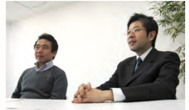
朝日新聞 WEBRONZA (2011年)

リクルートワークス研究所 オルタナS フランクリン・コヴィー・ジャパン ジャパンビジネスラボ News Picks