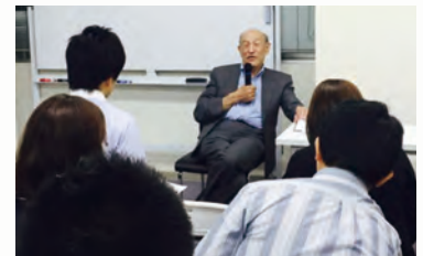
ハーバード大学 社会科学名誉教授 エズラ・F・ヴォーゲル氏による講演会

将来の日本を創るキーパーソンをお招きして開催する講演会です。2ヶ月に1回程度のペースで開催し、政治・ビジネス・NPOなど、各界から講師をお招きしています。