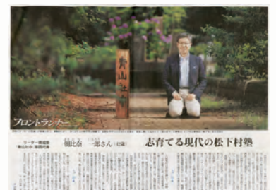
朝日新聞 フロントランナー (2015年)