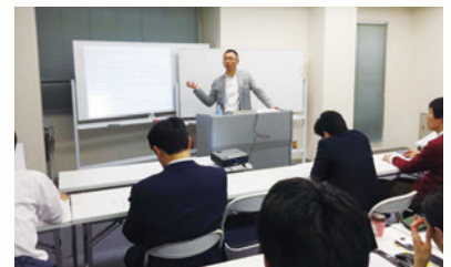
地方自治編の講義

パブリック・リーダーを育成することを目的とし、「リーダーシップ」と「政策」の両方を学ぶことをコンセプトにした学校で、各分野の第一人者が講義を担当します。1講座からの受講が可能なほか、講座期間内であれば遠隔者等のYouTube上での受講も可能です。