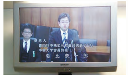
国会（内閣委員会）における 公務員制度改革についての意見陳述